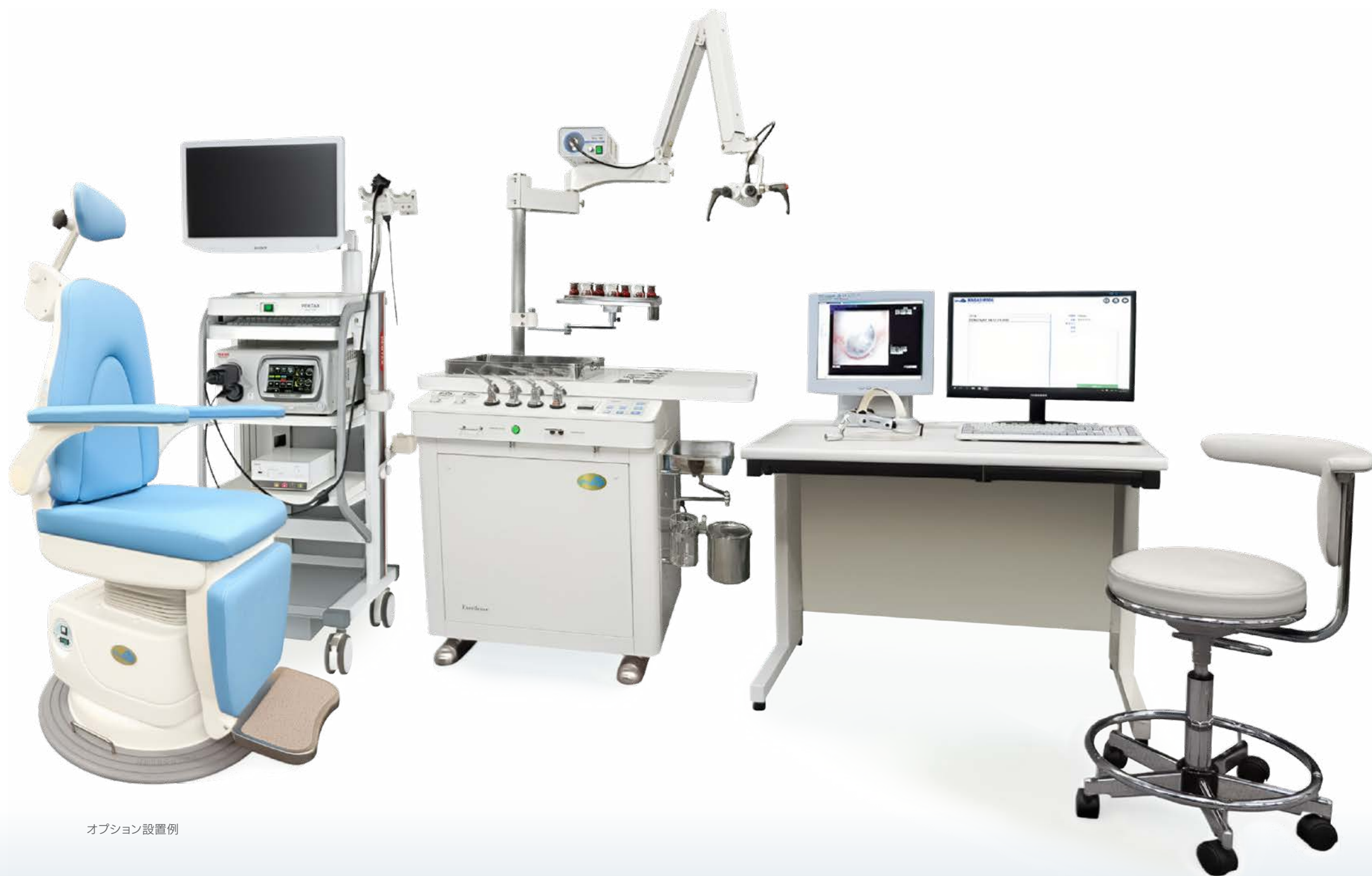
オプション設置例